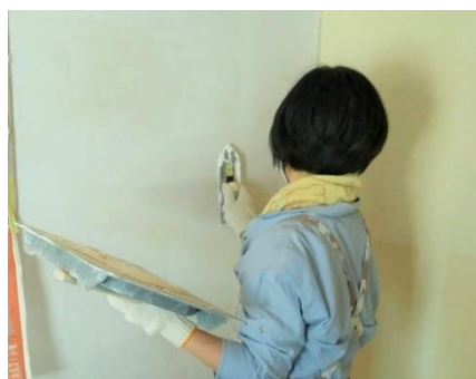
100%自然素材で安心です

コテの片側を立て気味にして、厚みは0.5mm以下を厳守し、できるだけ薄く塗り伸ばしてください。厚塗りをするとセルフを塗る時にセルフ自体の水が下塗りに吸われて塗りにくくなる場合があります。