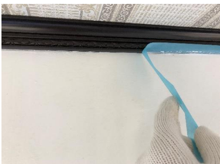
乾く前に剥がします

セルフルの仕上げ塗り後、乾いてしまう前（約1時間前後）にマスキングテープ、養生テープなどを剥がし、少し濡らした細めの刷毛を使いチリ際と漆喰の境目をゆっくり沿わせて端部をきれいに整えます。