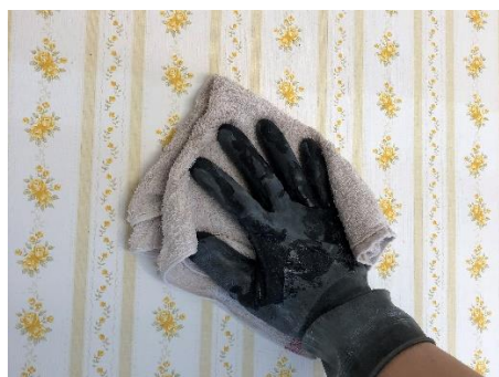
汚れを拭きとります

※ビニールクロスは出来るだけ全て剥がし、裏紙も全て剥がす事をお薦めしていますが、裏紙まできれいに剥がす事は大変な作業なので、しっかりと下地に接着し汚れ等もあまりない状態であれば、そのまま施工します。古いビニールクロスの場合、汚れの影響でしっくい表面にアクが出てくる事がありますので、アクが懸念される場合は市販のアク止め材（株）ハネダ化学 ハイポリックシーラーなど）を全面に塗布して下さい。