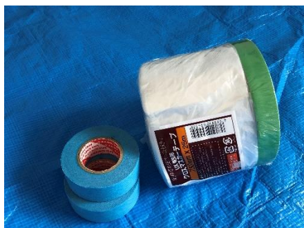
マスキングとマスキングテープ

柱や窓枠などの壁と接する部分（ちり隙）に、しっくいが付かないよう下地から2~3mm程空けてマスキングテープを貼ります。（下塗り材+しっくいの塗り厚が2.5mm程度の為）しっくいが木部に触れると変色する恐れがある為、それを防ぐ目的もあります。