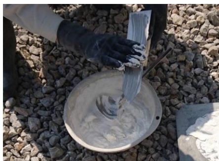
多く付いた漆喰は取ってから水洗いを

漆喰や下塗り材は固まると取れにくいので、道具類の清掃はなるべく早く行ってください。 道具をきれいに使うポイントは、コテやコテ板などに漆喰の付着が多くなったら、休憩前や作業途中でバケツに張った水を使い、ブラシなどでこまめに洗い落すことが大切です