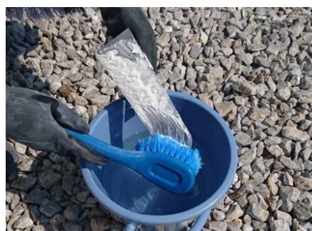
こまめな水洗いが大切です