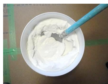
硬い時は少量の水を入れて ほぐします