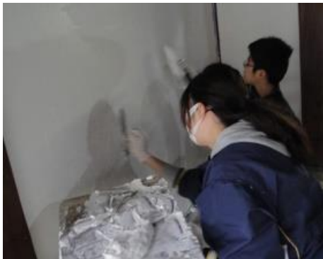
慣れると楽しくなります

セルフルは、お玉やコテでほぐしながらご使用ください。時間が経つと少し硬くなりますので、コテの感触が重く塗りにくい場合は、水を少し入れ柔らかくすると塗りやすくなります。コテ板やコテから落ちない程度の柔らかさが目安です。水の入れ過ぎにはご注意ください。