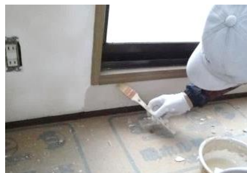
最後の仕上げは丁寧に