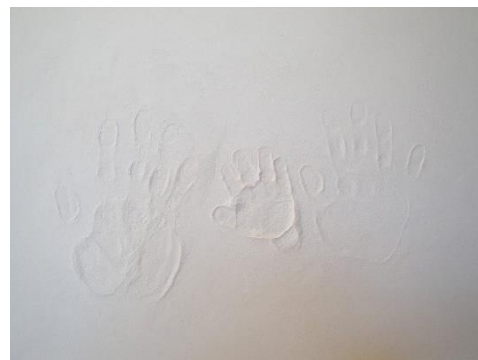
ご家族の手型も記念に

厚く塗る場合は全厚3mmまでを目安とし、それを超える厚塗りはひび割れやはがれの原因になることがありますのでご遠慮ください。