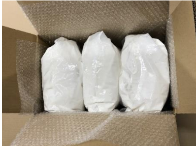
扱いやすい小分けタイプ

ケースからポリ袋入りのセルフルを取り出し、ポリ袋ごと充分ほぐして全体を均一の柔らかさにしてからバケツなどの容器に入れてご使用ください。ポリ袋をほぐす際は袋が破れないようにご注意ください。 電動のカクハン機を使ってしっかり練ると柔らかくなり過ぎますので、軽く混ぜる程度で調整してください。