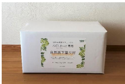
18kg入りは9kgポリ袋入り×2袋 ミニは9kgポリ袋入り×1袋

セルフ専用の「自然派下塗り材」を塗ります。上塗りのしっくい「セルフ」の接着力を高め適度な硬化を促進し、しっくいの仕上がりを良くする役割があります。ケースからポリ袋入りの下塗り材を取り出し、ポリ袋ごと少しほぐしてからバケツなどの容器に入れてご使用ください。 塗る時の感触が硬い時は少量（60 cc程度）の水を入れて表面からほぐして柔らかくすると塗りやすくなります。