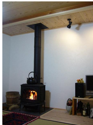
D I Yの施工例

※しっくい施工後は、湿気がこもらないように数日はこまめに換気をして空気を入れ替えてください。