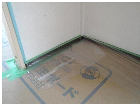
床にもしっくいが落ちます

しっくい等が付着して汚れないように、床部分やエアコン等にはビニール付きのマスキングテープを使用し全体をカバーします。照明、コンセントカバー、カーテンレールなど、外せるものは外してから養生してください。