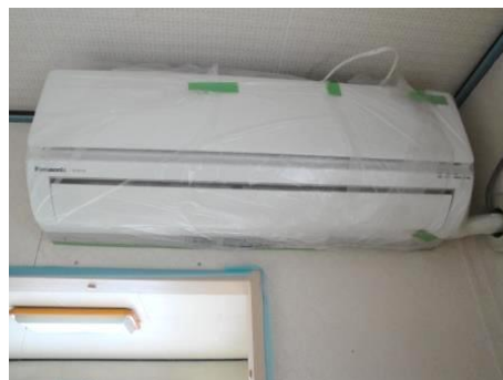
エアコンも養生でカバー