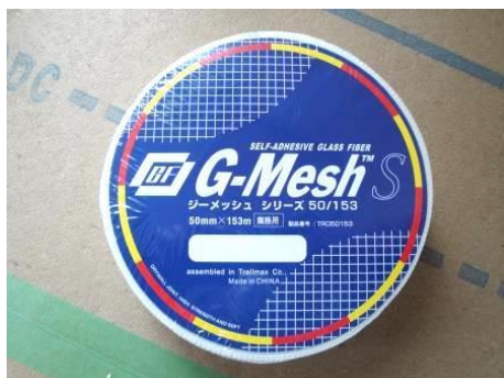
のり付きのジョイントテープ

ビニールクロスの浮き・剥がれを防ぐ為に、ジョイント（継ぎ目）部分にジョイントテープを貼ります。タッカー（建築用のホチキス、壁などに直接打ち付ける事ができる）でジョイント部分やビニールクロスの端部分を止めるとより耐久性がアップします。