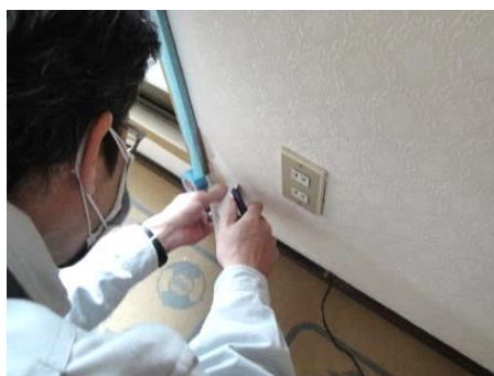
ビニールクロスの補修