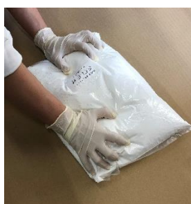
ポリ袋ごとほぐして 容器に入れてください