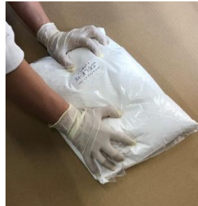
全体を充分ほぐして