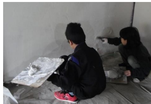
自分だけのしっくい壁をつくらう！

セルフル塗り 1 回目は下塗り面にコテでこすり付けるように約 1 mm の厚みで薄く塗りつけてください。その際、下塗り面と仕上げ塗りの間に空気が入ることがあるので、空気を抜くようにコテ圧を強めて塗ってください。手の届く範囲で 1 回目が塗り終わったら、すぐに 2 回目を約 1 mm 厚で塗り、全厚約 2 mm で仕上げてください。 セルフル塗りの 1 回目と 2 回目は時間をあけず続けて塗って仕上げてください。経過時間は季節によりますが、1 回目から 1 時間以上経過し表面が乾いた状態に 2 回目を塗ると、セルフルの水が吸われて塗りにくい状態になりますのでご注意ください。壁一面の途中では止めず、できるだけ面ごと、部屋ごとに仕上げていくようにしてください。