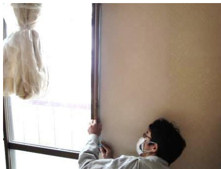
マスキングテープを貼ります